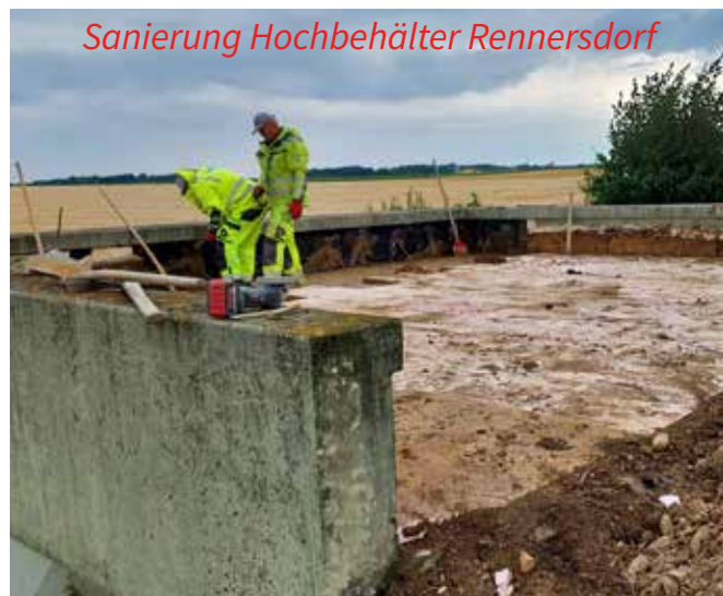
Sanierung Hochbehälter Rennersdorf